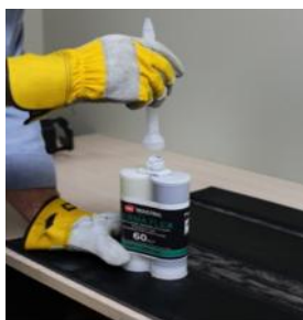
Przykręć mieszadło statyczne