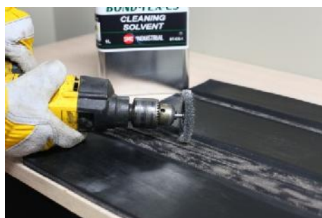
Przeszlifuj obszar naprawy