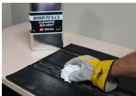
Wyczyść obszar naprawy rozpuszczalnikiem