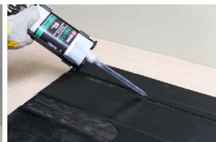
Zaaplikuj materiał naprawczy Perma-Flex