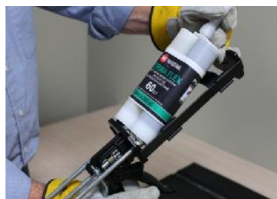
Włóż kartridż do narzędzia dozującego