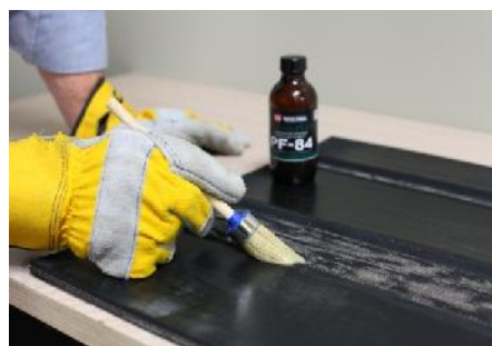
Zaaplikuj specjalną warstwę podkładową PF-84