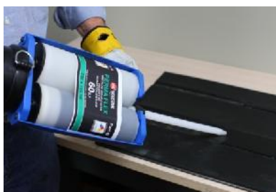
Do dużej powierzchni naprawy użyj kartridża 750